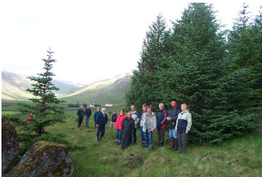
Að Hvammi í Hvammsveit