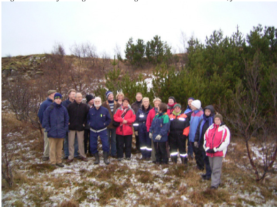
Á “Yfirlitsnámskeiði” í skógræktinni í Efri Hrepp.